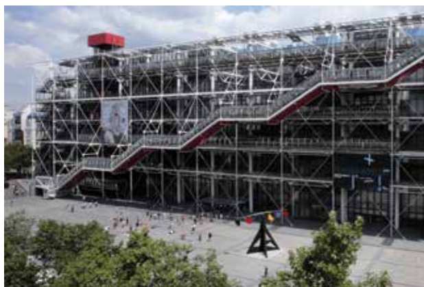
El Centre Pompidou, Paris

El Centre Pompidou, inaugurado en una zona céntrica de París en 1977, posee la colección de arte moderno y contemporáneo más importante de Europa. Sus más de 100.000 obras abarcan un periodo artístico que se extiende desde 1905 hasta hoy. Cada año, unas treinta exposiciones temporales atraen a millones de visitantes, como las exposiciones Matisse, Dalí y Roy Lichtenstein. La institución elabora además una amplia programación de música, danza, teatro, performances, ciclos de cine y conferencias. También forman parte del Centre Pompidou la biblioteca pública de información y el instituto de investigación y coordinación acústica y musical. El edificio, diseñado por los arquitectos Renzo Piano y Richard Rogers, es un monumento emblemático del siglo XX.